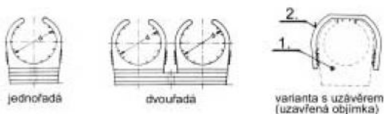
7.2-90 Svěrné objímky

Legenda: 1 – objímka; 2 – uzávěr objímky